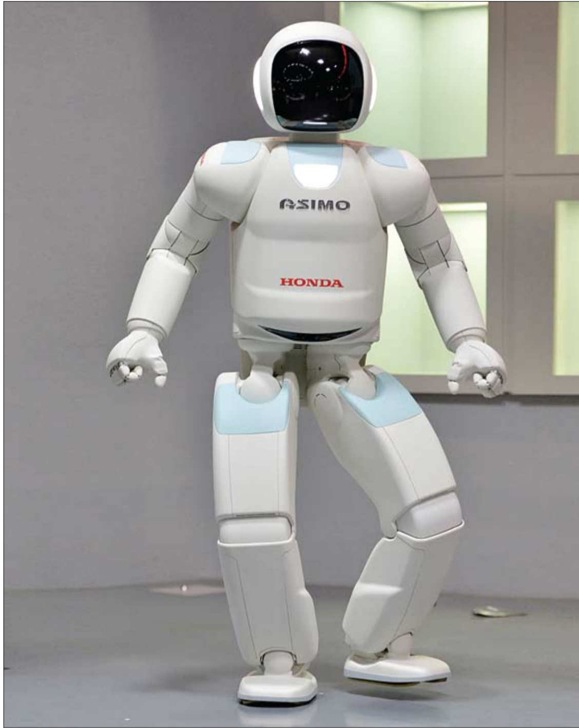
هوندا موتور تطرح الروبوت أسيمو الذي يتفاعل مع الزوار في المتحف الوطني للعلوم والابتكار بطوكيو.

وبالنسبة إلى الوحدات الحرارية، يأتي الليمون الهندي في المرتبة الأولى مع 43 وحدة حرارية في كل 100 غرام، مقابل 44 وحدة حرارية للبرتقال و53 للكيوي.